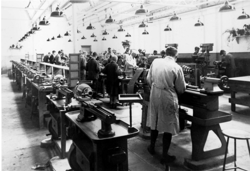
Productiehal Hazemeyer Signaalapparaten (1940-1945)